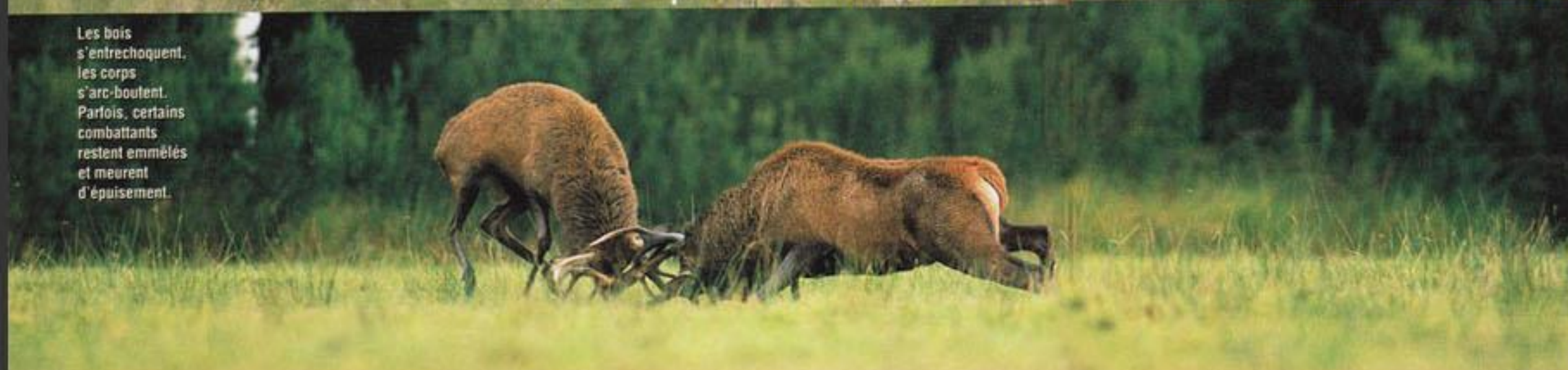
Les bois s'entrecroquent, les corps s'arc-boutent. Parfois, certains combattants restent emmêlés et meurent d'épuisement.

Très impressionnant, le brame mêle violence et séduction