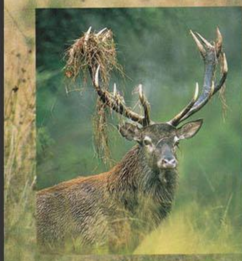
Ce mâle surexcité est tout en sueur à labourer l'herbe à grands coups d'andouillers.