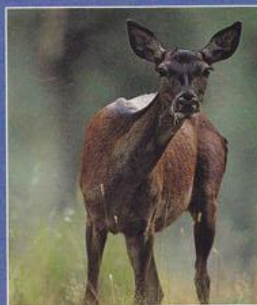
Terwijl de mannetjesherten de strijd aanbinden, wacht de hinde op de overwinnaar.

In het begin van de herfst is het mannetjeshert verliefd. Zijn machtig geloei rolt door de Ardense wouden.