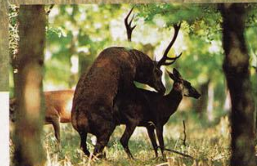
À l'abri des regards, les saillies sont difficiles à observer. Il arrive que la chance sourit, et cette vie secrète apparaît alors dans tout son naturel.