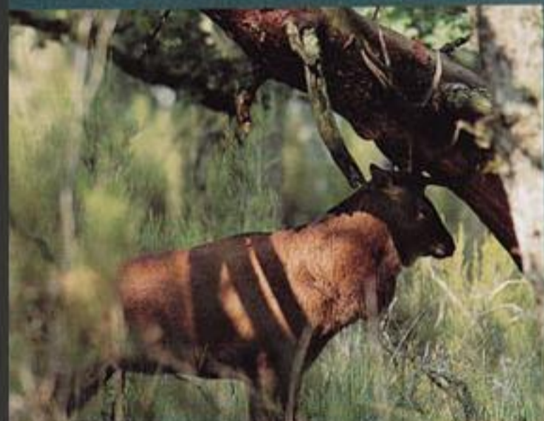
Apparemment tranquille, un jeune rival attend. Il ne tardera pas à provoquer le roi couronné. Une tension formidable naîtra, comme un orage, sous le regard des biches.