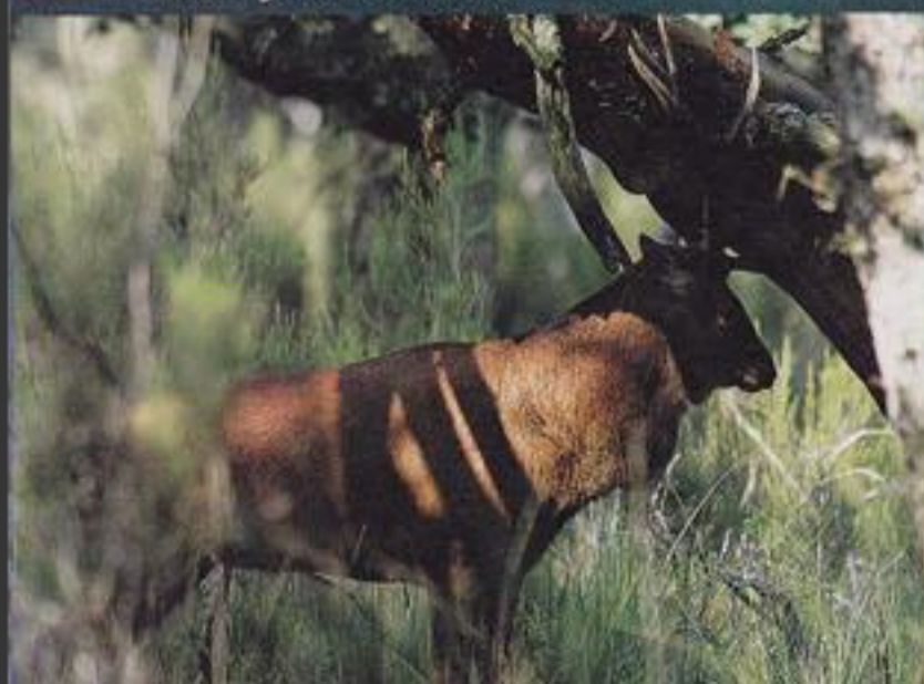
In de bronsttijd is het edelhert voortdurend opgewonden en gaat het de bomen en het gras met zijn gewei te lijf.